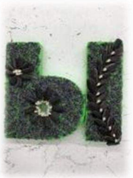
Мак, семечки подсолнуха