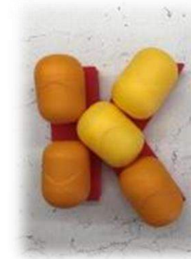
Яйца от «Киндер-Сюрприза»