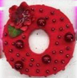
Велюр, красные бусины