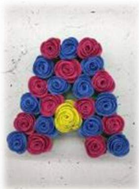
Цветы из фоамирана