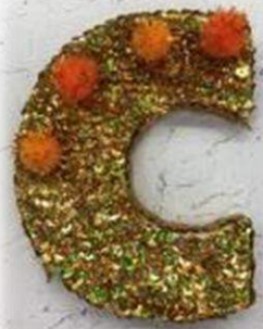
Золотистые пайетки, помпоны