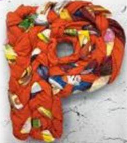
Косы из разных тканей