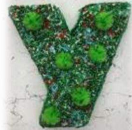
Цветной бисер, помпоны