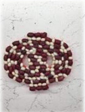
Белая и красная фасоль