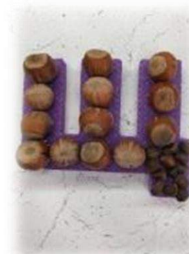
Орехи в скорлупе