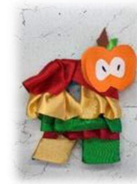
Атласные ленты, цветная бумага