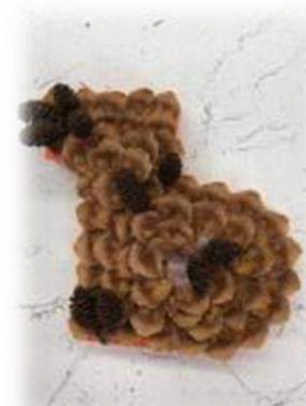
Чешуя шишек, мелкие шишки