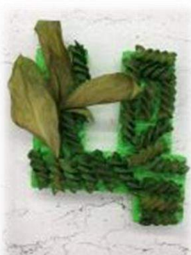
Крашенные макароны, листья