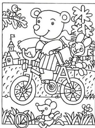
Если найдешь десять букв А, спрятанных на картинке, хорошо. Двадцать – отлично!

Другое любимое упражнение дошкольников, помогающее хорошо запомнить графический облик букв, – « Найди на рисунке и обведи как можно больше букв » (например, букв А).