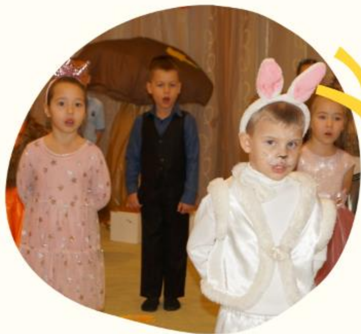
Ряжение в костюмы