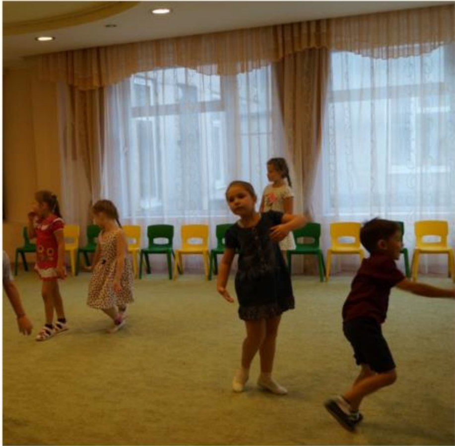
Упражнение "Изобрази героя"