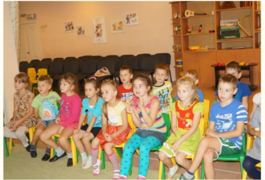
Беседа о правилах поведения в театре